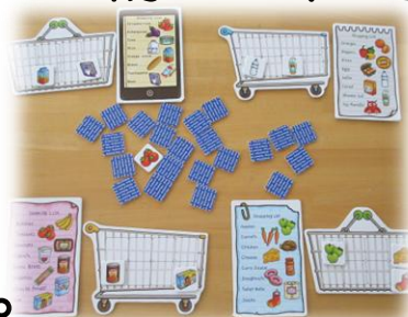
ショッピングゲーム

いちよう組では、冬から寝ない日の中で50分程、レッスンを行ってきました。初めの10分程は、絵本の読み聞かせ、歌、手遊び、カード遊び等、今までのようにトピックに基づいたレッスンをし、その後は、自分の好きな英語遊びを選んで過ごしました。CDをかけながら絵本を読む、アルファベットカードを並べてビンゴゲーム、色と形合わせゲーム、ワークシート、アルファベット並べ、動物探しゲーム等、友達同士で声を掛け合いながら楽しんでいました。中でもリストにある物（カード）を、買い揃えていくショッピングゲームは、「今日の英語でしたい！」と朝から声を掛けられる程人気でした。皆活発に遊び、あっという間に時間が過ぎているようでした。